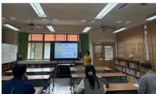
授課教師向觀課者說明課程脈絡