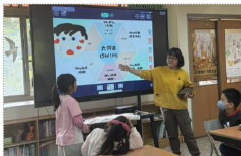
學生學習：學生透過自學、小組共作、互學完成學習任務