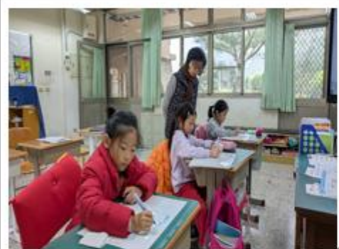
說明：運用小白板解題