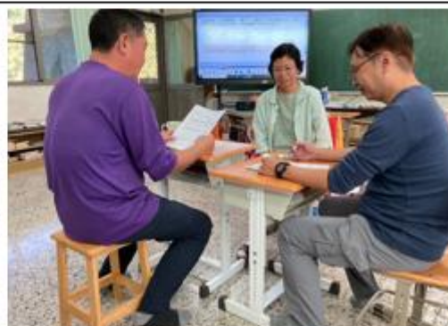
說明：課後進行議課