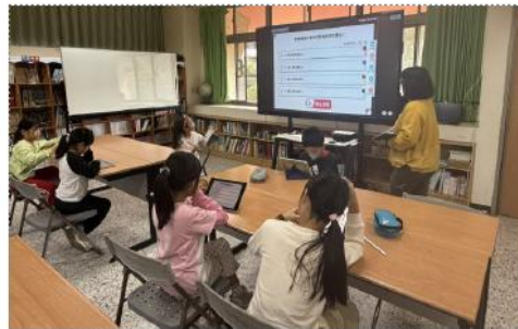
教師教學：透過遊戲檢測模式，了解學生對於文本的理解狀況