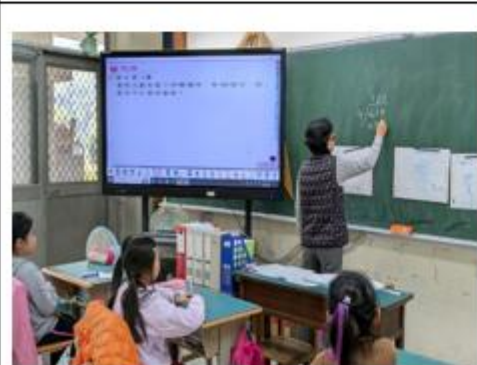
說明：老師講解學生的解題方法