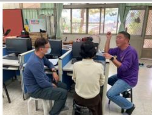
說明：運用整數四則運算