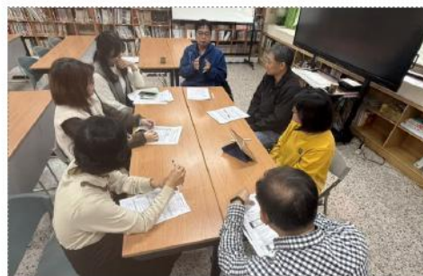
輔導員及觀課教師給予觀課回饋