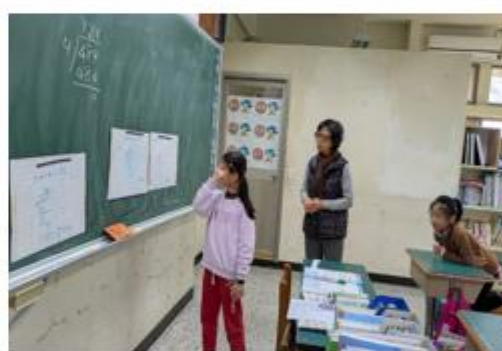
說明：學生踴躍發表自己的解題過程