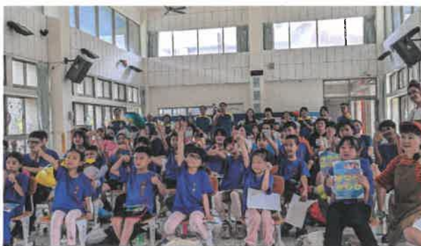
作品創作成功-活動圓滿達成