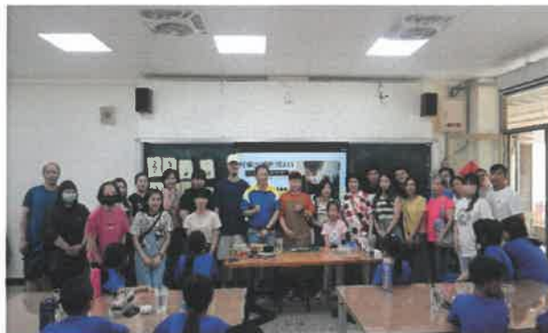
感謝家長踴躍出席參與