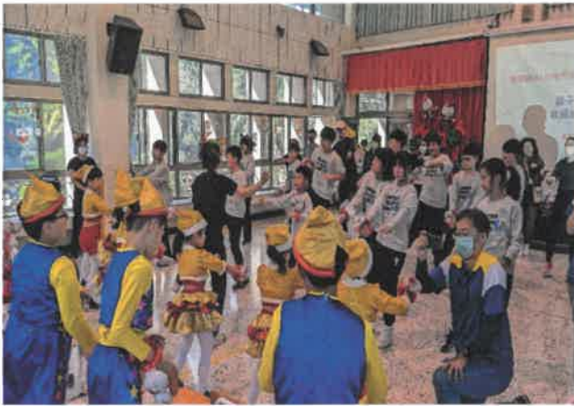
邀請家長出場上下同樂