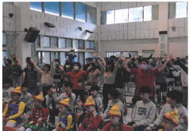
配合度很高的家長群