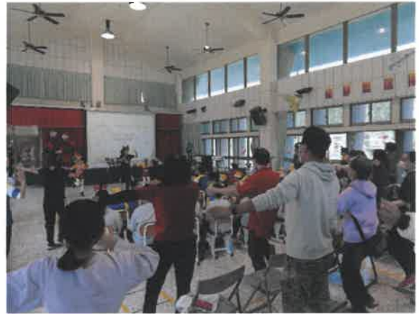
教導家長分解動作