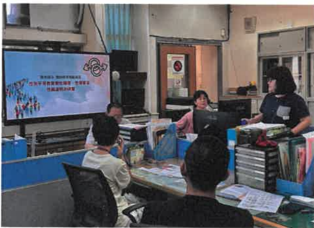
說明：性騷擾、性侵害及性霸凌防治研習