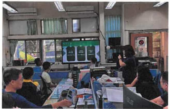
說明：認識性平三法