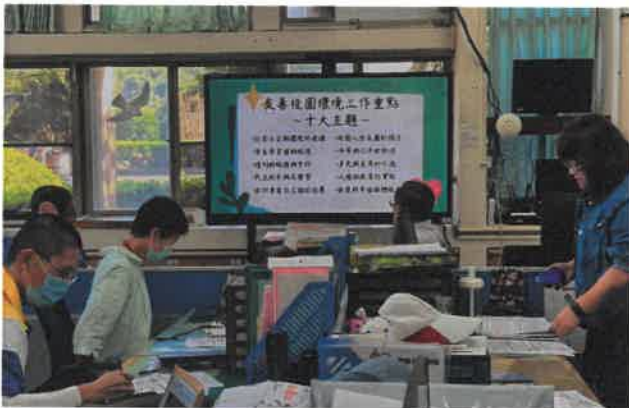
友善校園環境工作重點-十大主題