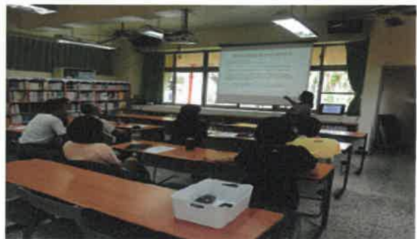
結合眾人力量共同討論輔導策略個案輔導