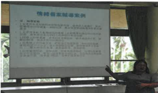
舉例情緒個案如何輔導