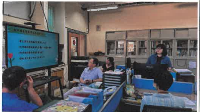
說明教師輔導管教學生應循事項