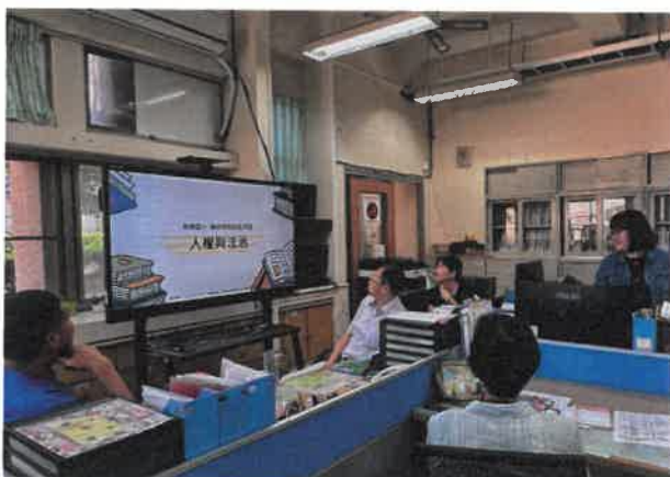
人權與法治教師知能研習