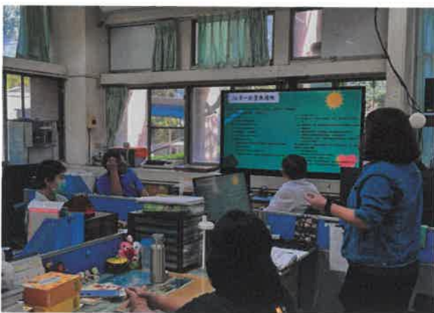
說明 16 項一般管教措施