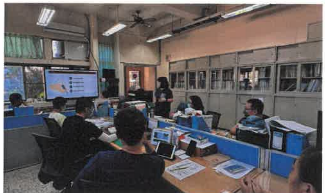
說明：性平事件相關法規之修法重點