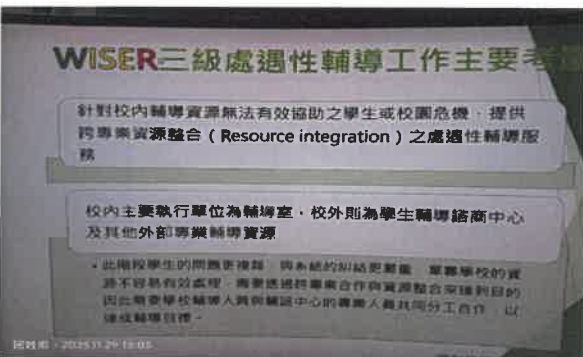
WISER 學校三級輔導工作如何進行