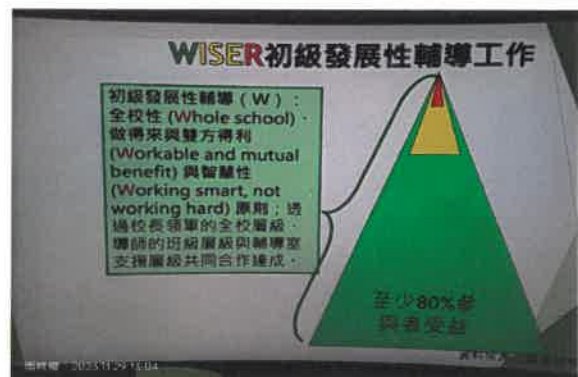
導師是發展性輔導工作的執行者