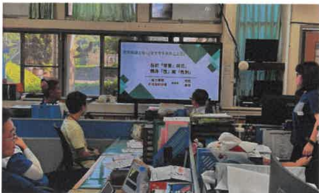
說明：理解發生性平事件的主因