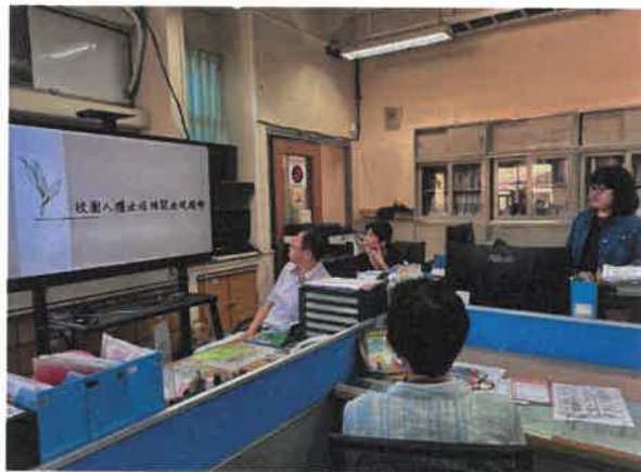
說明校園人權法治相關法規趨勢現況