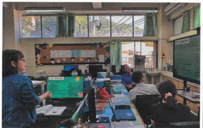
教師同仁仔細聆聽管教措施之說明