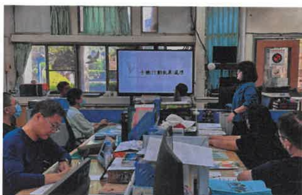
說明手機與行動載具之處理規定